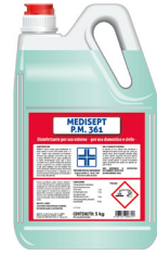
MEDISEPT P.M. 361