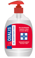
OXALIS GEL DISINFETTANTE MANI