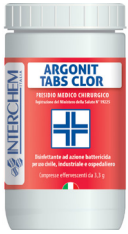
ARGONIT TABS CLOR