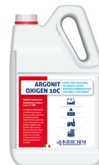
ARGONIT OXIGEN 10C