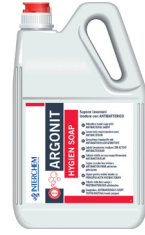
ARGONIT HYGIEN SOAP