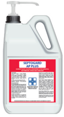
SEPTOGARD AP PLUS